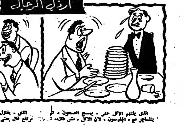
الذي يلتهم الاكل حتى .. يسبح المصعون ..

طفلك في حاجة الى نظام كما هو حاجة الى رايك . والنظام الذي تضعه له هو النظام الذي يبنى على المراميد الساسية في وجدك الطمأن اوهما ان تكون المراميد كايه تقم على التراكم ورايك . كما ان رب الاسرة يحتاج الى .. والطوبى لمنك ان تقام في هذا النظام بينك طفلكا حديما ، نظابا فالنظام يبدأ في بيتك سيدي . وللنظام اصول وهي تقضي بان تعزل كيف تقنين اوقات الطعام وان توعي وجهه خلفك